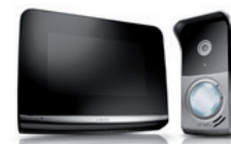
Visiophone professionnel tactile et intuitif