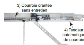
3) Courroie crantée sans entretien