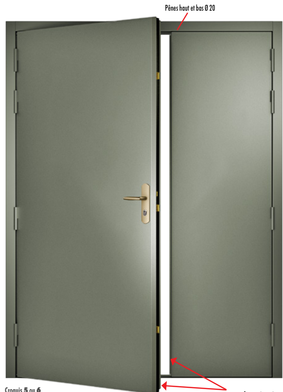
Pênes haut et bas Ø 20