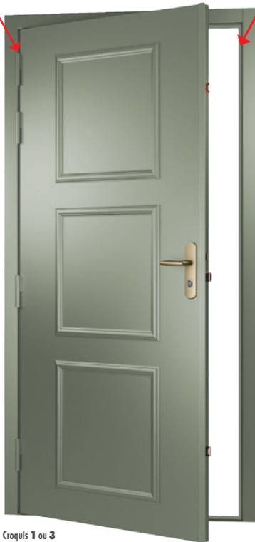
Croquis 1 ou 3